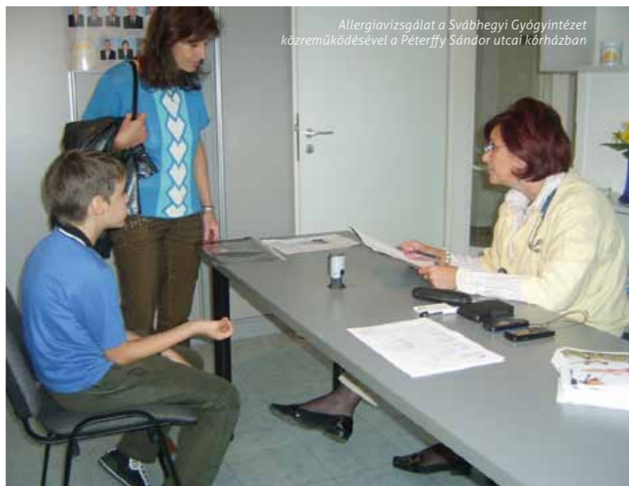
Allergiavizsgálat a Svábhegyi Gyógyintézet közreműködésével a Péterfy Sándor utcai kórházban

Az ellátás előzetes telefonos bejelentkezés alapján lehetséges, és ingyenes.