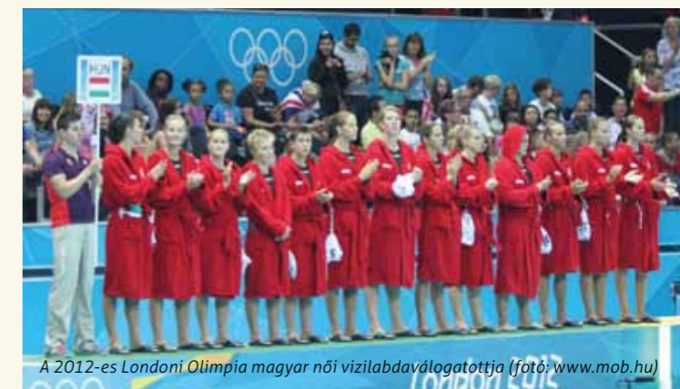
A 2012-es Londoni Olimpia magyar női vízilabdaválogatottja