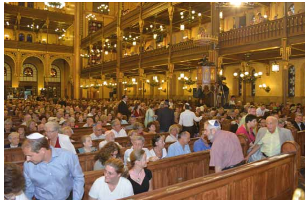
A Dohány utcai zsinagóga köré szerveződött az első fesztivál

a rendezvény egyik állandó helyszínévé lett.