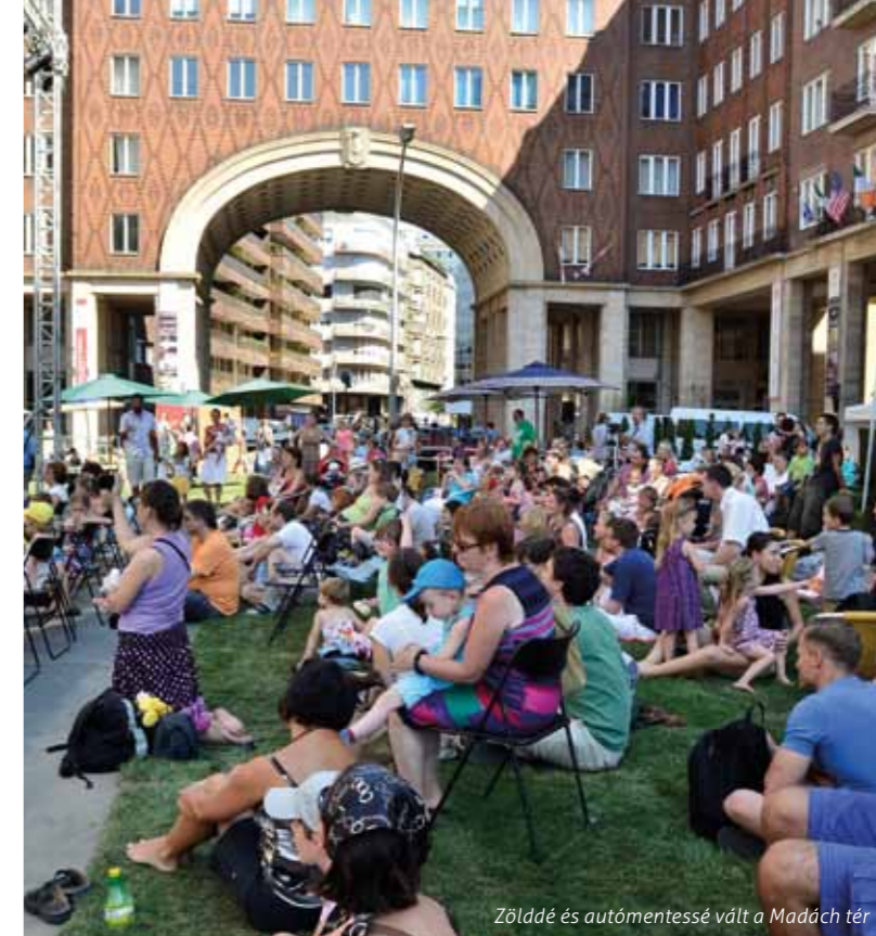
Zölddé és autómentessé vált a Madách tér

A programon kisorsolásra került Ezerarcú Erzsébetváros című nyerevénykönyvek átvehető az Erzsébetvárosi Önkormányzat épületében (Erzsébet kert. 6.).