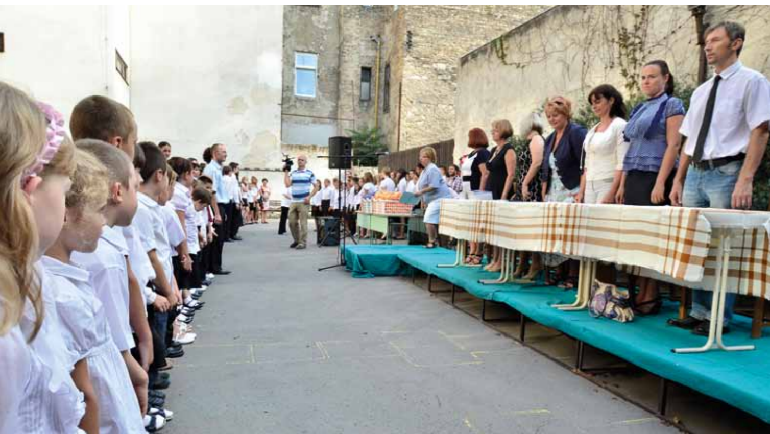
Rónaszékine Keresztes Monika országgyűlési képviselő is az évnyitón köszöntötte a kisiskolásokat

közoktatási törvény helyett az Országgyűlés tavaly év végén elfogadta a nemzeti köznevelési törvényt. A kerettörvény elnevezése nem véletlen: egységbe foglalja az óvodától a tankötelezettség végéig tartó oktatási időszakot, s annak lényegi alapját a nevelésben határozza meg. A szeptember 1-jétől fokozatosan életbe lépő törvény végrehajtási rendeletein még dolgoznak, de a törvény nyomán tavasszal elfogadták az új Nemzeti Alapanyagtervet (NAT), amely 2013. szeptember 1-jétől felmenő rendszerben – először az első, ötödik és kilencedik évfolyamon – lép hatályba.