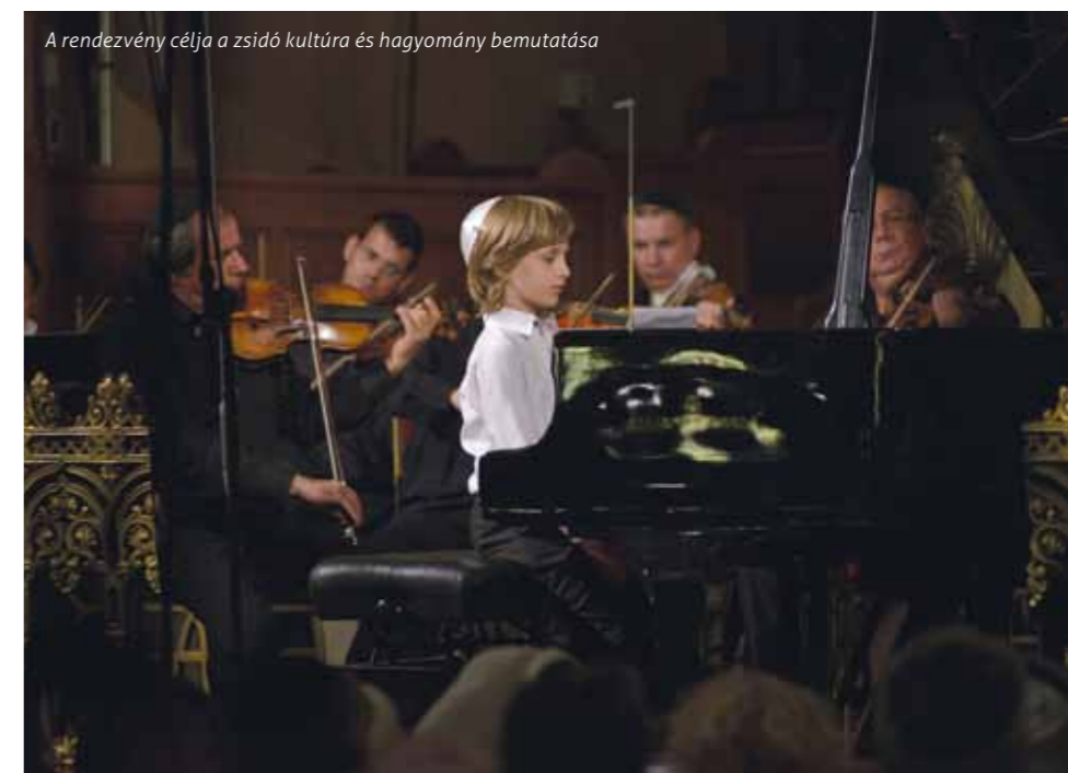
A rendezvény célja a zsidó kultúra és hagyomány bemutatása

Hat évvel ezelőtt a Rumbach Sebestyén utcai zsinagóga is megnyílt a látogatók előtt, amely azóta szintén