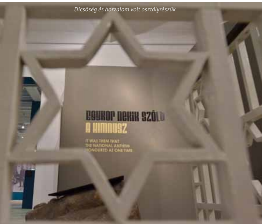
Dicsőség és borzalom volt osztályrészük

Hajós Alfréd (1878–1955) az első magyar olimpiai bajnok, úszó és labdarúgó, nagyhírű építész-mérnök. Egy időben Alpár Ignác Almássy téri irodájában dolgozott, ő tervezte többek között a margitszigeti sportuszodát, amely a nevét viseli.