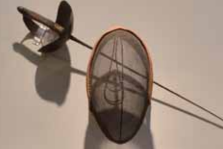
Petschauer Attila élete és halála dalt és filmet ihletett

Weisz Árpád (1896–1944), aki a legnagyobb labdarúgóedzők egyike volt, Auschwitzban ölték meg. Éveken át dolgozott Olaszországban, itthon elfeledték, Itáliában monográfia jelent meg róla, és Bologna stadionjának falán emléktábla őrzi nevét.