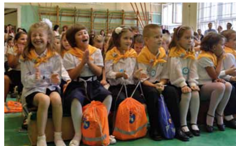
Narancssárga és kék csomagokat vehettek át az elsősök

Ismert, hogy ősztől már hatályosak a köznevelési kerettörvény főbb elemei. Mielőtt az Országgyűlés tavaly év végén elfogadta volna a köznevelési törvényt, az új oktatási kormányzat 2010 nyara óta – vagyis a Fidesz kormány az első intézkedései között – több ponton változtatott a korábbi közoktatási rendszeren. Az egyik legkorábbi módosítás,